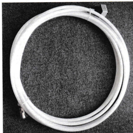
Рисунок 2 – Общий вид АДТ-01Т